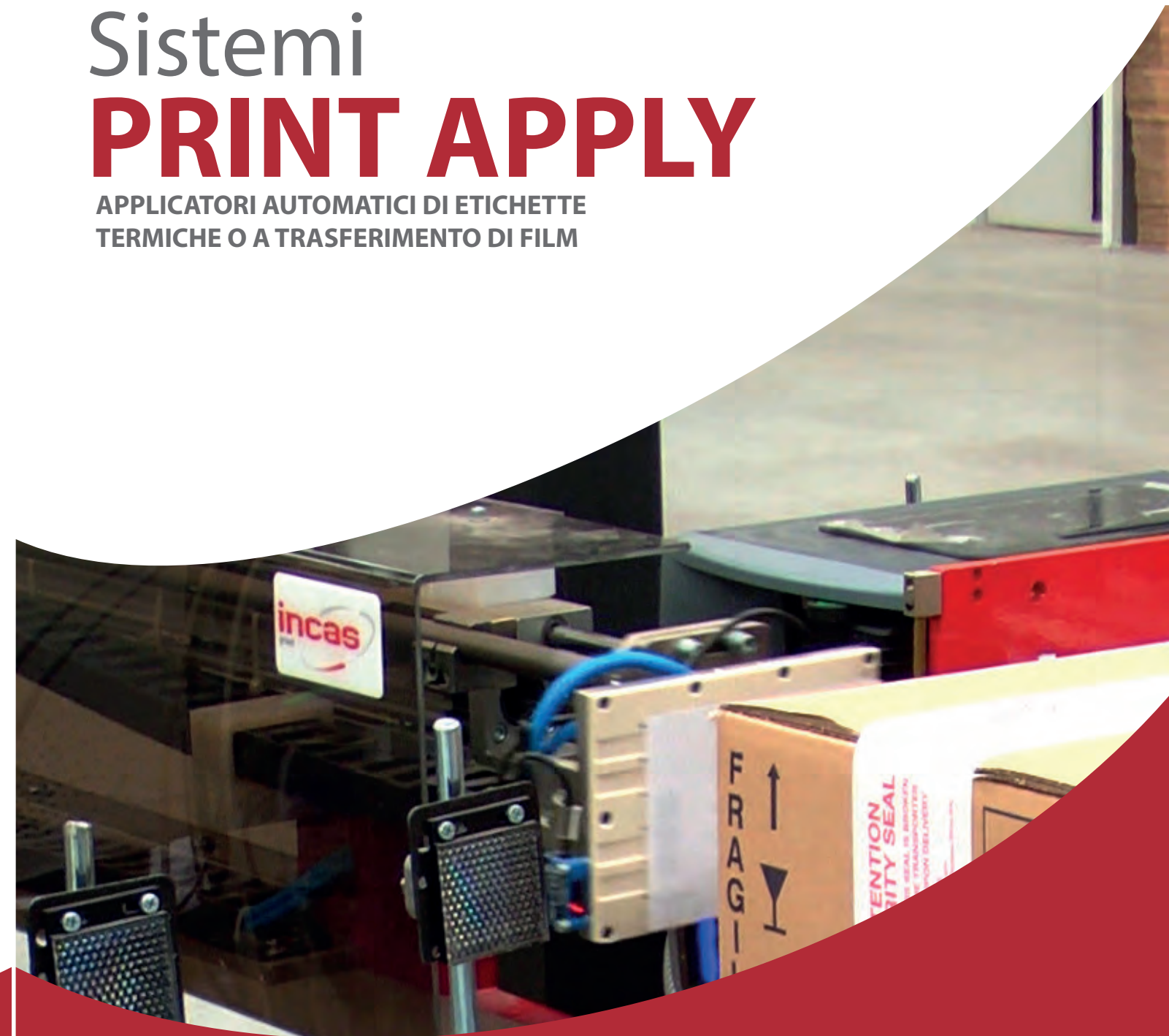
Versione Iron in acciaio